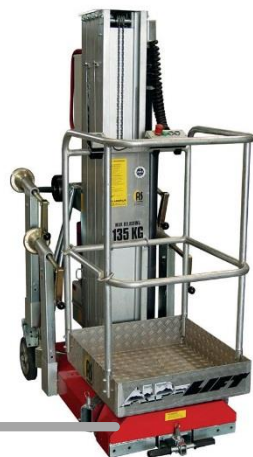
ALP – PHC940